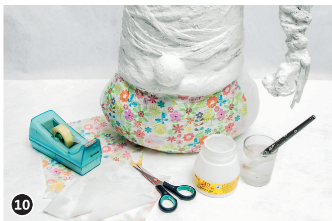
10 De bovenste, bedrukte laag van de servet verwijderen van de beide niet bedrukte lagen. Servet in de gewenste grootte knippen. Servet met de onderkant op het lichaam leggen. Met een borstelpenseel, van binnen naar buiten, voorzichtig lijm op de servet strijken. Gebruik een zachte borstelpenseel. Het lichaam geheel met servetten beplakken. De servettenlijm een nacht laten drogen.