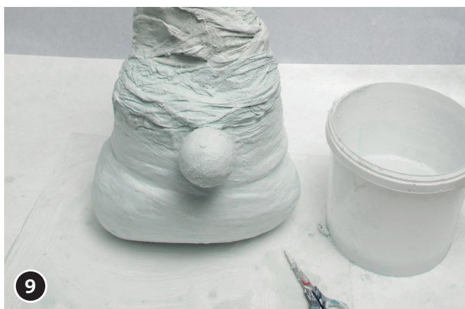
9 Complete draad-muts met gipsbanden omwickelen. Gipsband ca. 1 - 2 dagen laten drogen.