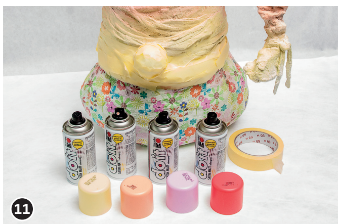
11 Kabouter muts verven. De verf goed laten drogen.