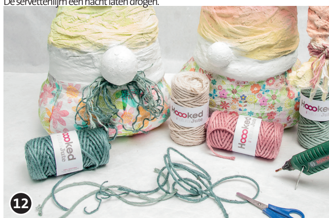
12 Voor strik en baard het jute gebruiken. In de gewenste lengte afknippen, knopen evt. met een lijmpistool (of lijm) fixeren.